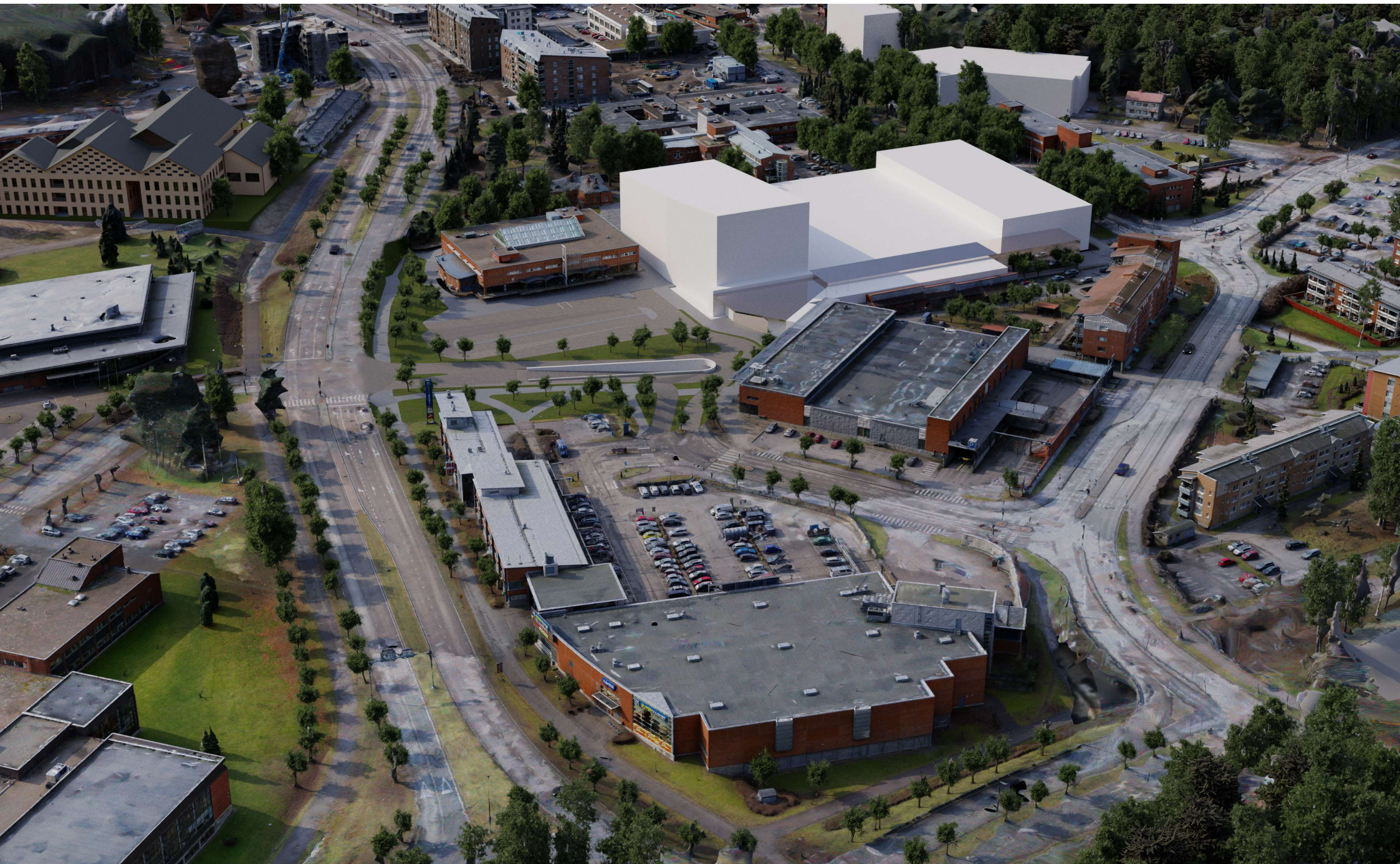
Ve 2 pohjoisesta