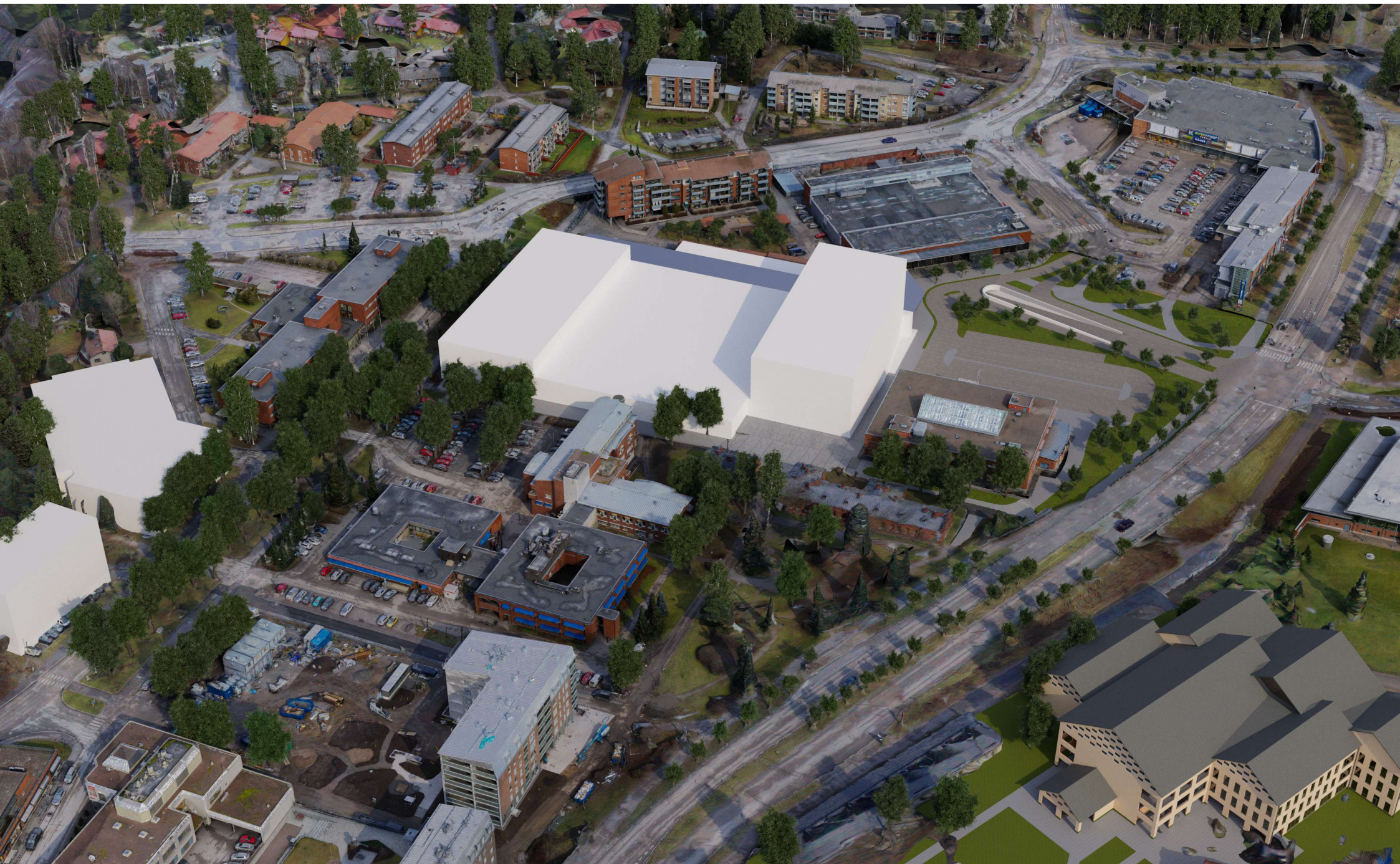
Ve 2 etelästä